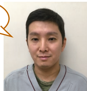
一般社団法人 日本獣医皮膚科学会

今を時めく講師お二人による「究極のコラボセミナー」、一人でも多くの先生方にご参加いただけたら幸いです。